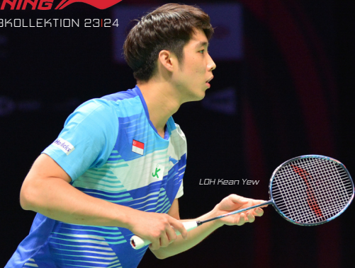
LOH Kean Yew