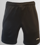
Team Shorts Black