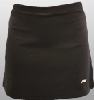
Team Skirt Black